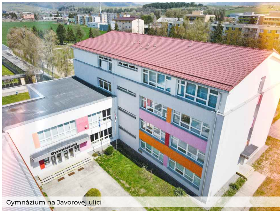
Gymnázium na Javorovej ulici

Rajecké gymnázium má v našom meste už 67 ročnú tradíciu. Žilinský samo-