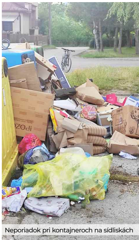
Neporiadok pri kontajneroch na sídliskách

Z tohto dôvodu sme do vrecového zberu od rodinných domov zahrnuli aj zber papiera a skla. Každá dotknutá domácnosť dostala do svojej poštovej schránky vrecia, QR kódy a leták, ako bude takýto zber prebiehať.