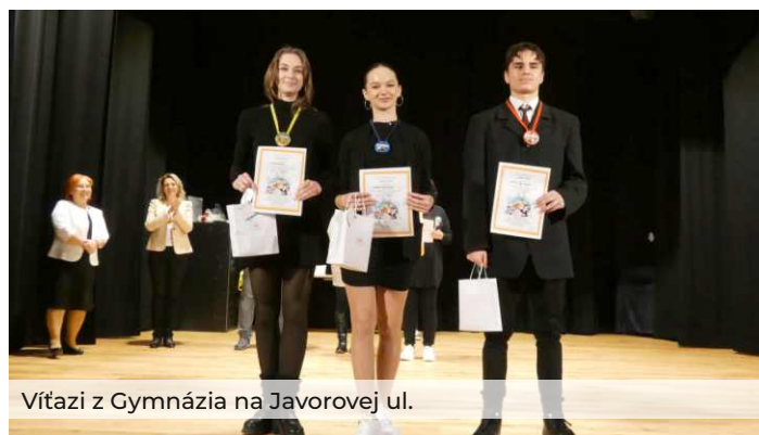
Vítazi z Gymnázia na Javorovej ul.