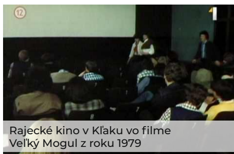
Rajecské kino v Klaku vo filme Veľký Mogul z roku 1979