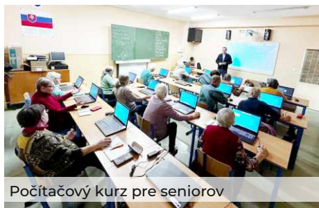
Počítačový kurz pre seniorov

Pre seniorov je toto dobrodružstvo nielen o objavovaní nových technológií, ale aj o udržiavaní spojenia so svetom, rodinou a priateľmi. Kurz im pomôže prekonať digitálny rozkol a získať dôveru v práci s počítačom. Výuka je zameraná na praktickú stránku, s využitím jednoduchých návodov, ukážok a cvičení. Zohľad-