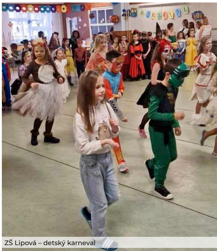
ZŠ Lipová – detský karneval