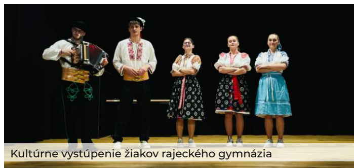
Kultúrne vystúpenie žiakov rajeckého gymnázia