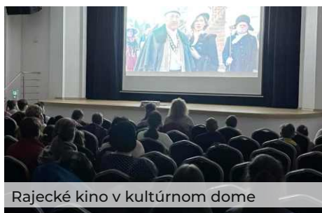
Rajecské kino v kultúrnom dome

ňuje individuálne tempo každého účastníka. Naším cieľom je odstrániť digitálnu priepasť a umožniť záujemcom plne využiť všetky výhody digitálneho sveta. Spolu objavíme nové možnosti, ktoré budú používať s radosťou a bez obáv.