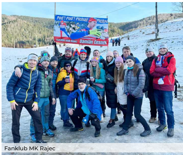
Fanklub MK Rajec