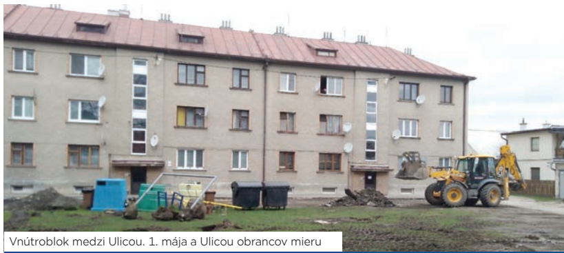
Vnútroblok medzi Ulicou. 1. mája a Ulicou obrancov mieru

Po niekoľkých mesiacoch, keď bolo vzhľadom na nepriaznivé klimatické podmienky nevyhnutné dočasne prerušiť práce, opäť na sídlisku Sever a Ulici 1. mája v Rajci intenzívne pokračuje výstavba.