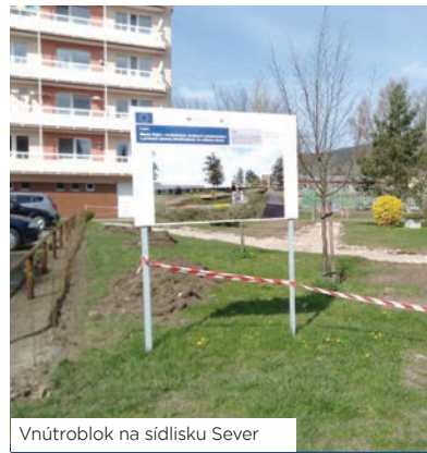
Vnútroblok na sídlisku Sever