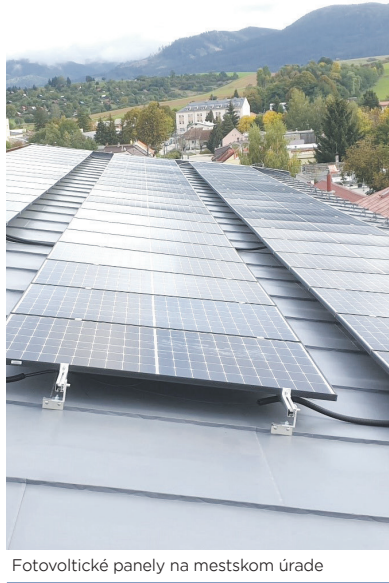
Fotovoltaické panely na mestskom úrade

Na príprave projektu intenzívne pracujeme. O ďalších podrobnostiach vás budeme priebežne informovať.