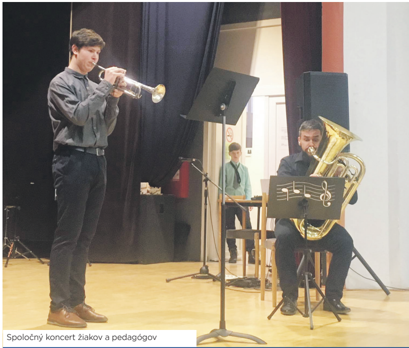
Spoločný koncert žiakov a pedagógov

Máme za sebou prvý ročník celoslovenskej výtvarnej súťaže Frivaldského prírodovedná ilustrácia. Súťaž organizujeme v spolupráci s mestom Rajec.