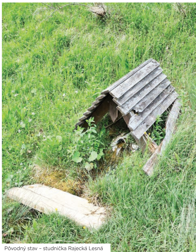
Pôvodný stav - studnička Rajecká Lesná