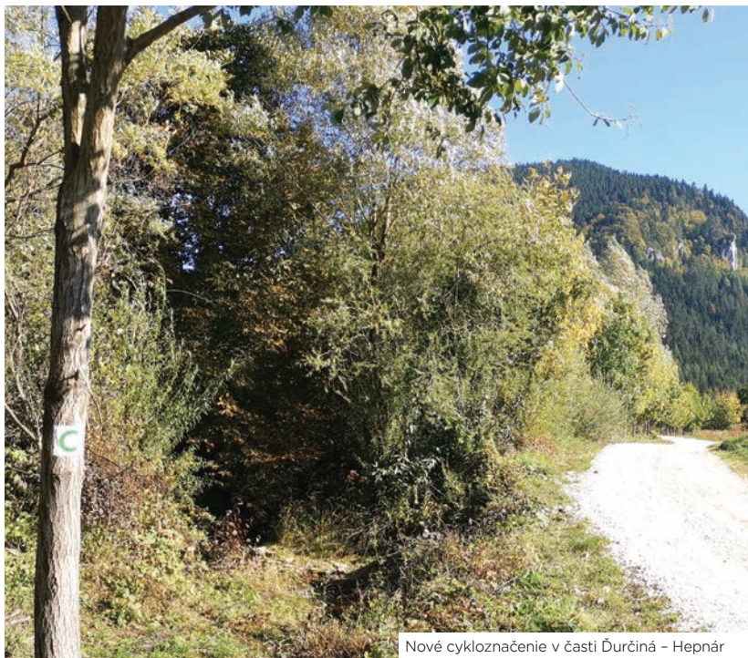
Nové cykloznačenie v časti Ďurčiná – Hepnár