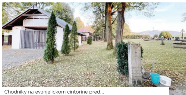
Chodníky na evanjelickom cintoríne pred...