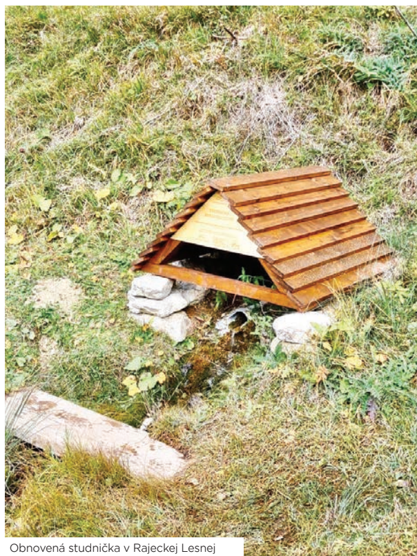
Obnovená studnička v Rajeckej Lesnej