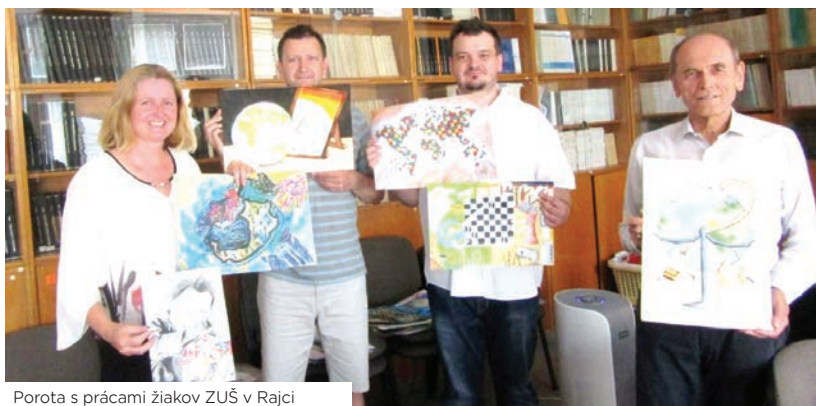
Porota s prácami žiakov ZUŠ v Rajci