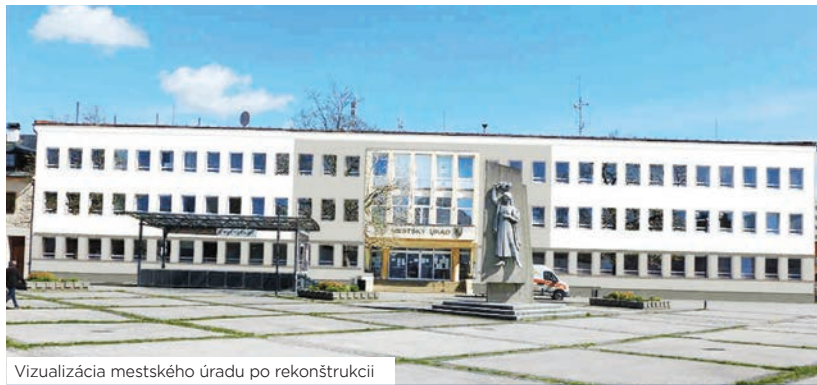
Vizualizácia mestského úradu po rekonštrukcii

hodnotiaceho kola, navyše výpočet tzv. hodnoty za peniaze nám vyšiel na maximálny možný počet bodov. V prípade, že budeme so žiadosťou úspešní, budeme realizovať zateplenie obvodového plášťa, zateplenie strechy a suterénu, vymeníme okná, zmeníme systém vykurovania na vykurovanie prostredníctvom tepelných čerpadiel a fotovoltaiiky, plánovaná je aj rekonštrukcia a debarierizácia vstupu do budovy.