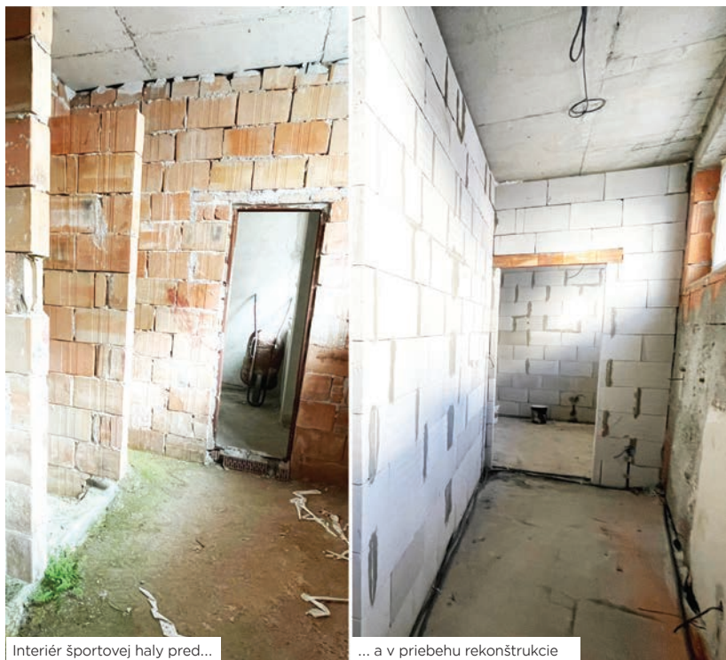
Interiér športovej haly pred...

V budúcom roku bude potrebné zrekonštruovať schody na kato-