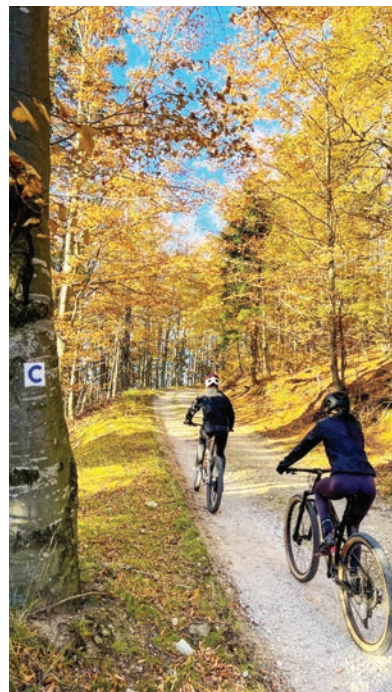
Kunerad – Omegová

infraštruktúry sledujeme touto aktivitou aj posilnenie vnímania našej destinácie ako destinácie s bohatým a zachovalým prírodným dedičstvom, kde element vody zohráva podstatnú úlohu. Nehovoriac o tom, že táto aktivita má aj pozitívny dopad na životné prostredie, pretože predpokladáme, že turista si svoju plastovú fľašu touto vodou naplní a odnesie domov a prázdnu fľašu nezhodí.“