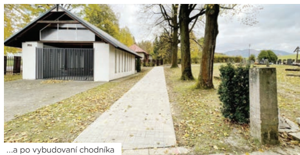
...a po vybudovaní chodníka