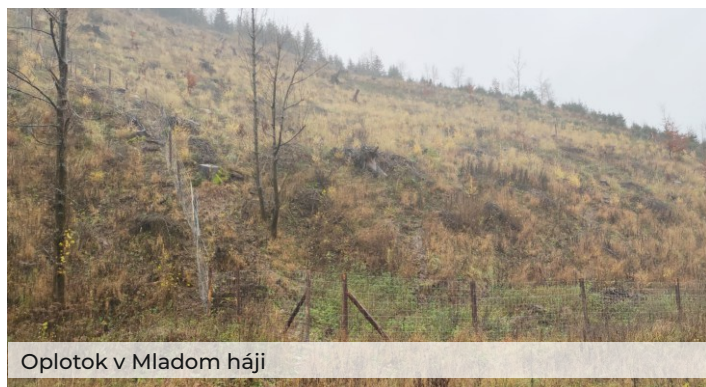
Oplotok v Mladom háji