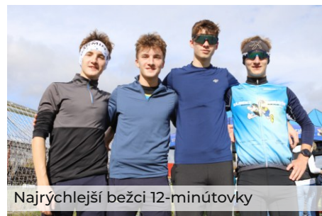
Najrýchlejší bežci 12-minútvy

Všetkým členom klubu ďakujeme za vzornú reprezentáciu doma i v zahraničí.