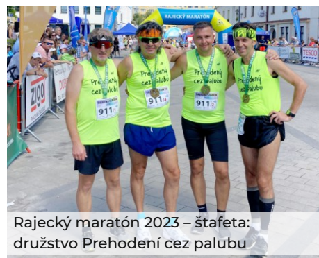
Rajecký maratón 2023 – štafeta: družstvo Prehodení cez palubu

iným spôsobom – pomohli pri organizovaní a priebehu 27. ročníka Medvedieho okruhu.