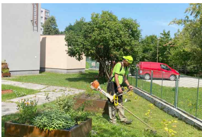
Kosenie trávnych plôch v MŠ