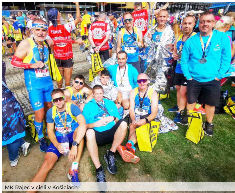
MK Rajec v cieľi v Košiciach