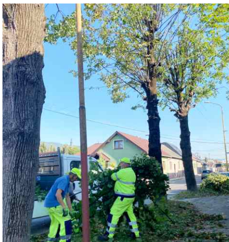
Jesenné orezávanie stromov