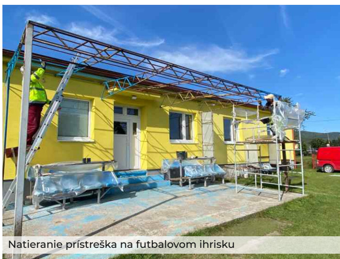
Natieranie prístreška na futbalovom ihrisku

Pracovníci TSMR sa starajú o údržbu verejnej zelene mesta Rajec v celkovej výmere približne 70 000 m 2 . Údržba verejnej zelene má v každom meste nesmierny význam. Zeleň má pozitívny psychologický vplyv na obyvateľov mesta, a taktiež zohráva dôležitú úlohu z estetického, ekologického a hygienického hľadiska.