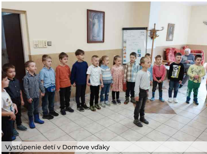
Vystúpenie detí v Domove vďaky

Ale veľké ĎAKUJEM patrí v tomto období, v mesiaci október, aj našim starkým. Patrí im vďaka za to, že obetovali svoj život pre dobro a spokojnosť svojich detí a vnúčat, aby sa mali lepšie.