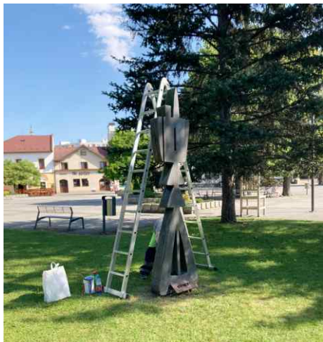
Ošetrovanie a natretie sôch pamätníka