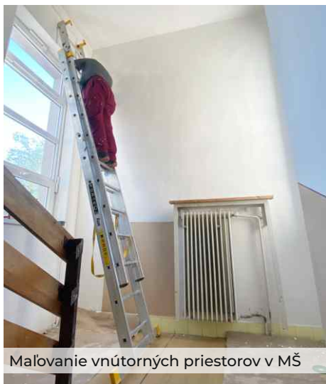
Maľovanie vnútorných priestorov v MŠ