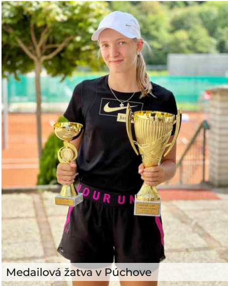
Medailová žatva v Púchove