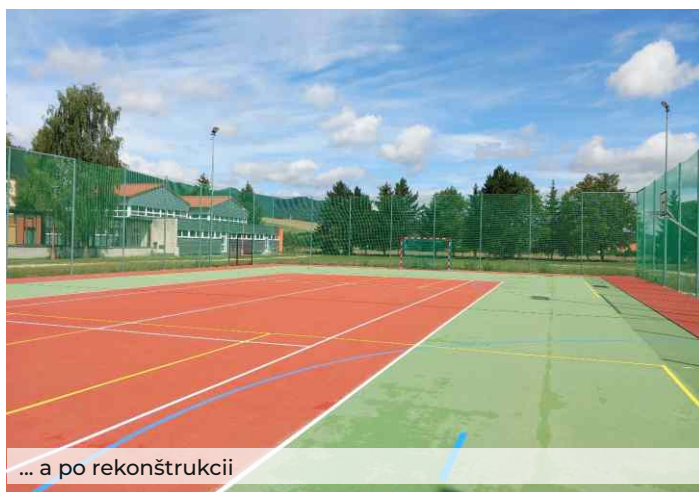
... a po rekonštrukcii