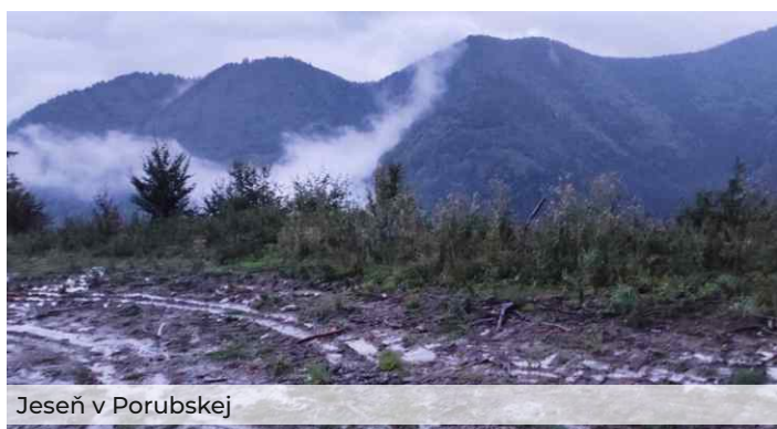
Jeseň v Porubskej