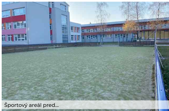
Športový areál pred...