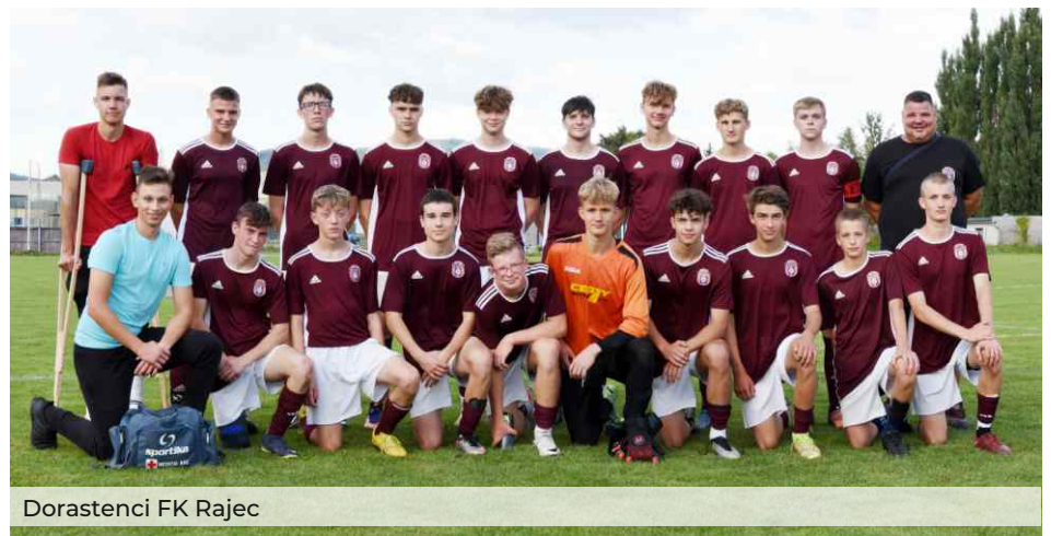
Dorastenci FK Rajec

Dorastenci stále idú za svojim cieľom, ktorý si určili pred sezónou. Po 8. kole sú