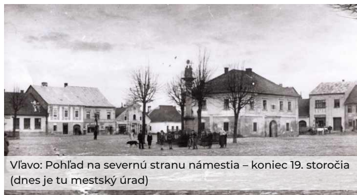
Vľavo: Pohľad na severnú stranu námestia – koniec 19. storočia (dnes je tu mestský úrad)

Na námestí sa zachoval klasicistický TROJIČNÝ STĹP so sochou Svätej Trojice. Bol postavený zo štedrých darov občanov v roku 1818. Na piedestáli sa nachádza reliéf patróna hasičov sv. Floriána.