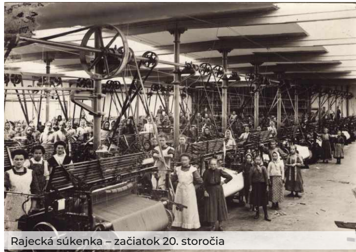
Rajecká súkenka – začiatok 20. storočia

Navzdory tomu, že bol Rajec poddanským mestom, dostal v priebehu storočí od panovníkov rôzne VÝSADY, ktoré napomáhali jeho hospodárskemu vývoju. V roku 1604 cisár Rudolf II. vydal pre mesto privilégium, podľa ktorého mohli Rajčania šesť dní v roku usporadúvať v meste jarmoky. V roku 1609 Matej II. oslo-