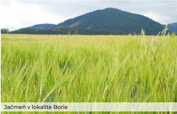
Jačmeň v lokalite Borie