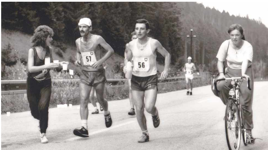
Uhlárikovci na Rajeckom maratóne v roku 1989