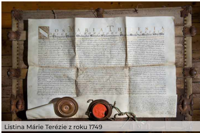
Listina Márie Terézie z roku 1749

Kontrolný súpis rajeckých remeselníkov vykonaný úradníkmi Trenčianskej župy dňa 24. apríla 1772 uvádza najmenej 7 remeselníckych cechov – mäsiarov, garbiarov, valchárov súkna, čižmárov, kožušníkov, kováčov, krajčírov a v nich 275 majstrov. Okrem týchto sa v súpise spomínajú ešte: 7 súkenníci, 15 tkáči