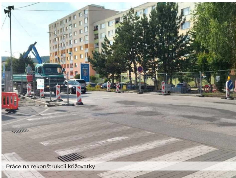
Práce na rekonštrukcii križovatky