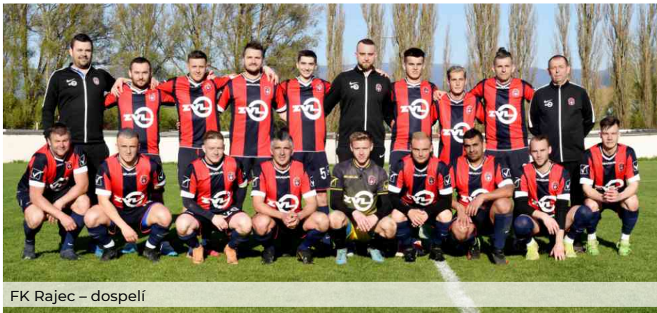
FK Rajec – dospelí