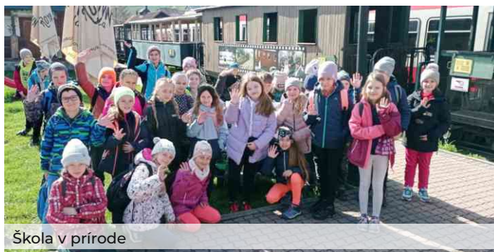
Škola v prírode

Pozornosť a matematické schopnosti si vyskúšali 119-ti žiaci v 25. ročníku medzinárodnej matematickej súťaži KLOKAN. Ús-